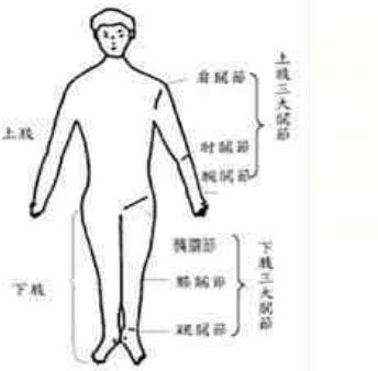
(2) 上、下肢關節生理運動範圍一覽表