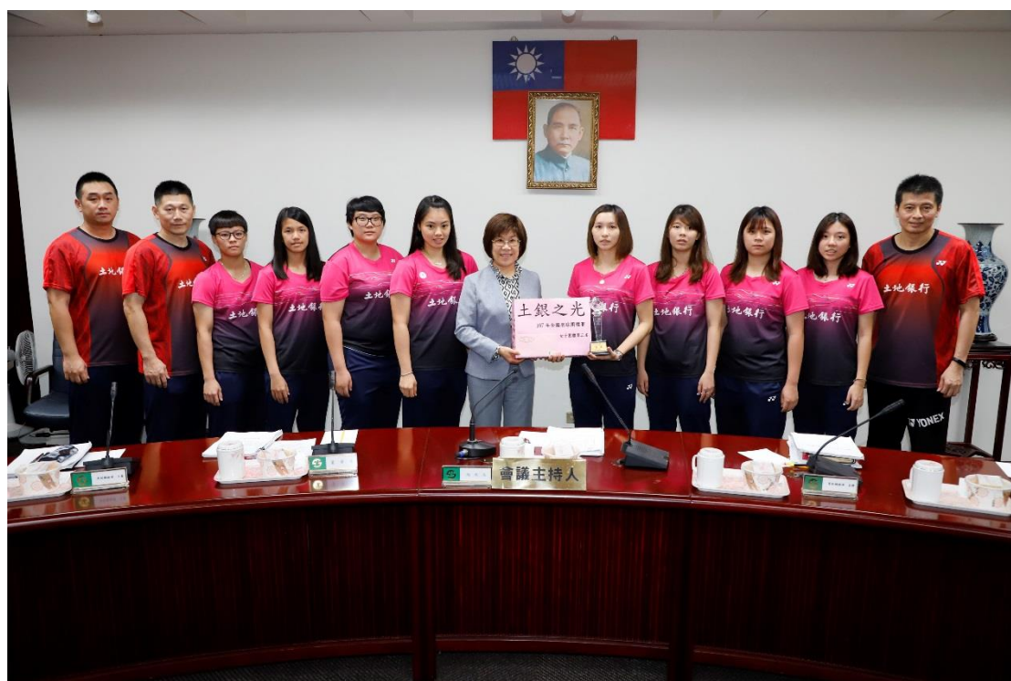
凌董事長與教練團及女子隊球員合影。