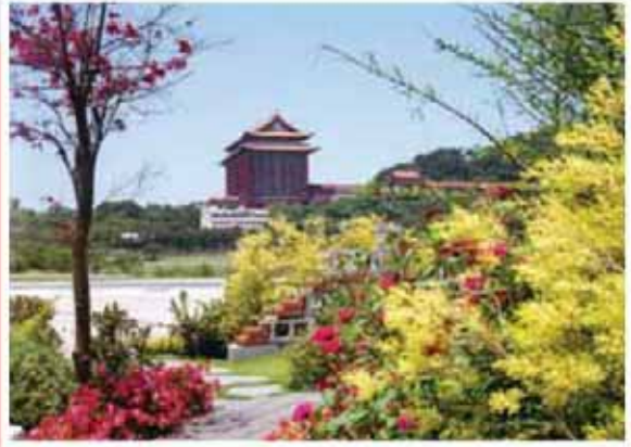
台北花博【圓山之美】