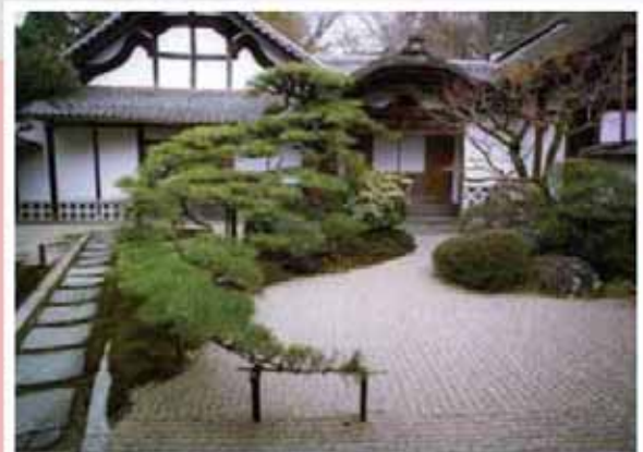
日本滋賀縣 石山寺【盤龍】