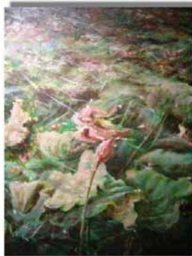
迎戰颱風夜的荷花