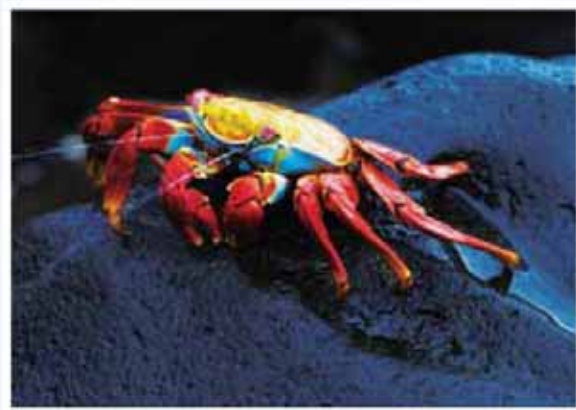
加拉巴哥群島--紅蟬噴水