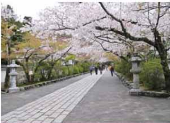
日本滋賀縣 石山寺【迢迢石板路】