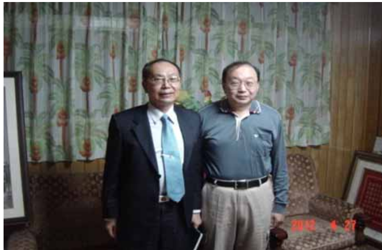
拜訪黎明里里長-宣導清淨家園