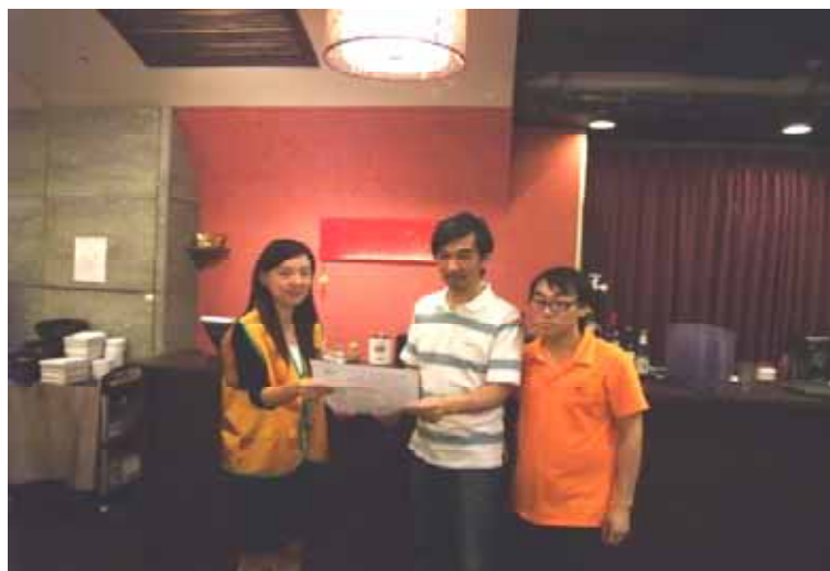
拜訪社區商家(元泰食餐廳)-宣導清淨家園

◆關心地球、愛護地球是每一個人的責任，希望藉由我們的努力，從關心自己的地方做起，進一步結合社區、村里民眾的力量，共同參與清淨家園，為後代子孫留下一片淨土。