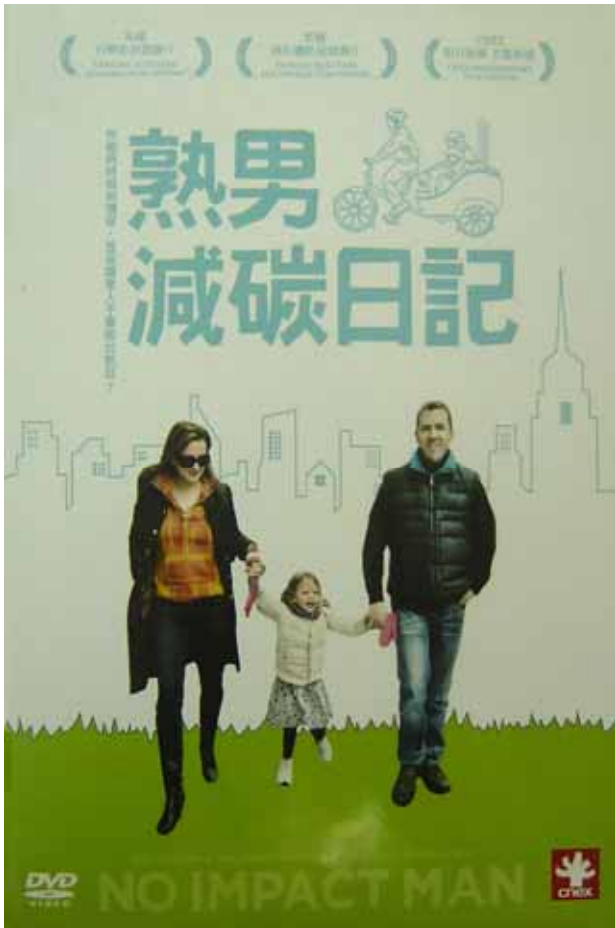
影片 1-熟男減碳日記