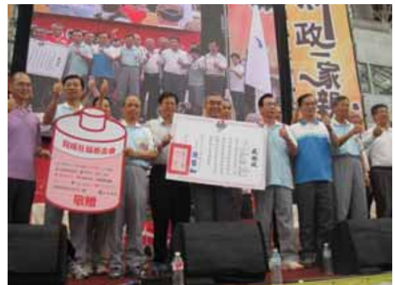
所有的長官貴賓一起合影