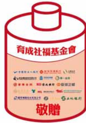
捐贈電池活動 15 個單位擁躍響應