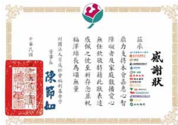
育成立社會福利基金會回贈感謝狀