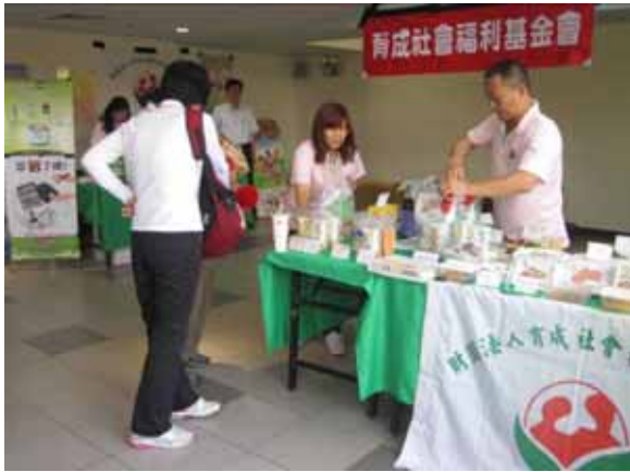
育成立社會福利基金會攤位

◆為慶祝建國 100 年，舉辦「財政盃聯合趣味運動大會」，搭配「珍愛大地愛心園遊會」活動，為關懷弱勢，邀請社會弱勢團體設攤，本次活動共募得廢電池、廢光碟及廢手機計 1,819.34 公斤，會場發放桂花樹苗 300 株及 1,500 棵小盆栽供與會人員認養，同步宣導環保，散播綠色種子，攜手護地球，善盡企業社會責任。