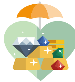
特定物品保障升級 金銀、珠寶、玉石、首飾、 皮草、皮飾、皮貨、鐘錶、 書籍