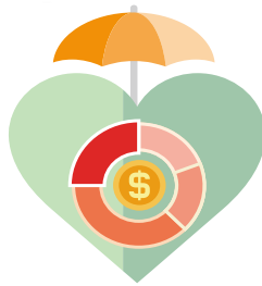
不受不足額 比例分攤