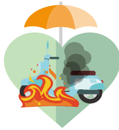
機車火災事故保障