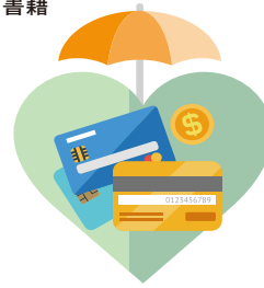
額外費用保障升級 金融信用卡及證件重製費用 租屋仲介費用 搬遷費用 生活不便補助金