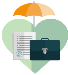
個人動產擴大承保 (工作、出差、租賃地點及 暫時物品搬遷因火災事故 所致損失)